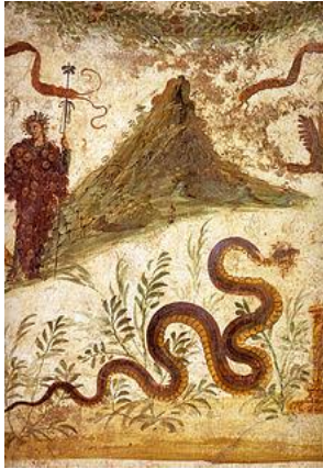
Der Berg in der Antike

4. Ein Berg verliert seine Spitze (vgl. die beiden Bilder). Welcher Berg ist das? Wie verlor er die Spitze? Wann verlor er sie?