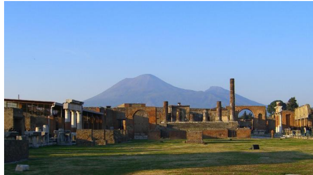
Derselbe Berg heute

5. Die Hügel Roms – Drei Irrläufer haben sich hineingeschlichen. Finde diese!