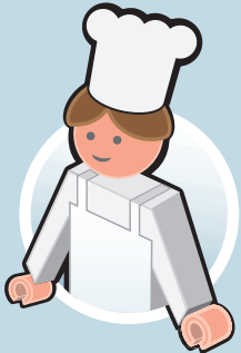
MITTAGESSEN IN KITA, SCHULE UND HORT

Und jetzt: Machen Sie mit! Informieren Sie sich, was vor Ort möglich ist. Sprechen Sie auch die Vereine in Ihrer Nähe an, die noch nicht beim Bildungspaket dabei sind. Stellen Sie Anträge so früh wie möglich und heben Sie Belege, Rechnungen und Anmeldungen immer auf. Diese Leistungen sind drin im Bildungspaket: