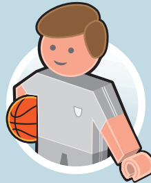
KULTUR, SPORT UND FREIZEIT