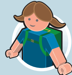
AUSFLÜGE IN KITA UND SCHULE